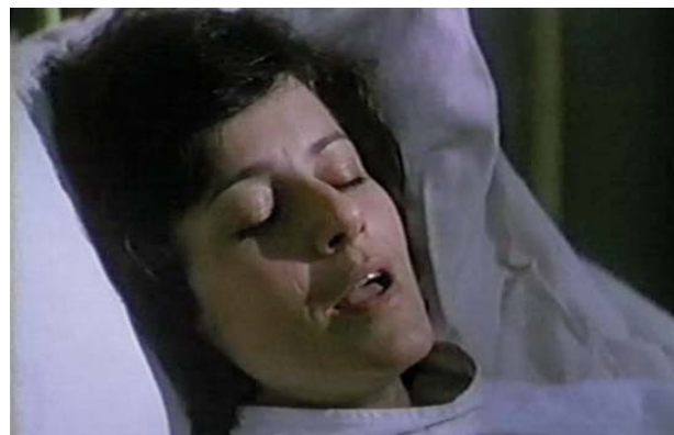
Foto 9: ... tú qué piensa Jack, soy judía, divorciada, no tengo dinero... ¿crees que me harán descuento?

Con Joy, por primera vez en su vida, Jack hace la experiencia del sufrimiento vivido en primera