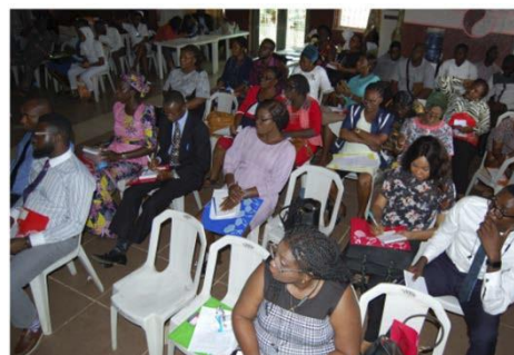
Picture 4: A cross section of the Participants during the Course

Modulo 1 . Principle & Concept of Palliative Care, Philosophy ♣ Pain Management ♣ -Pain Assessment ♣ History ♣ Total Pain Concept. Pain treatment: a. Pharmacological - b. Non-Pharmacological - Symptom Control ♣ GIT Symptoms ♣ Respiratory Symptoms, Neurological Symptoms Communication Skills ♣ Communication among Healthcare Practitioners (Caregiver Burnout), Patients and Families ♣ Breaking Bad News ♣ Facilitating Family Conference ⇨ Preferred Place of Death ⇨ Advanced Care Plan.