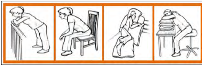
Fig.3 Posiciones para respirar mejor

ANSIEDAD. Es muy frecuente en los portadores porque el diagnóstico de COVID-19 puede ser recibido como una amenaza de muerte MNF: Acompañamiento, relación de ayuda, transmitir tranquilidad y confianza. Explicar al paciente y familia la situación en la que se encuentra y actuación. En casos más intensos, se pedirá la ayuda de un psicólogo. Diazepam 2-5 mg IV, 10 mg rectal c/8-12 h, Lorazepam SL 0.5-1 mg c/8h o Midazolam 2.5- 5 mg SC/IV y PRN hasta 10-15 mg/24 h en perfusión continua. D.Rescate: Lorazepam SL o midazolam 2.5-5 mg SC o IV.